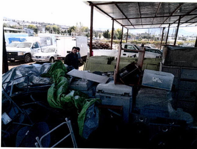
Imagen relacionada con el Punto PRIMERO de la presente Acta.

Imágenes relacionadas con el Punto SEGUNDO de la presente Acta.