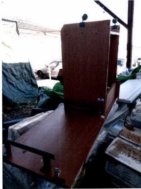
10. Mesa para computadora