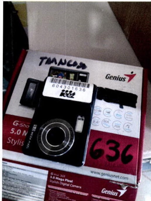
19. Cámara digital Genius