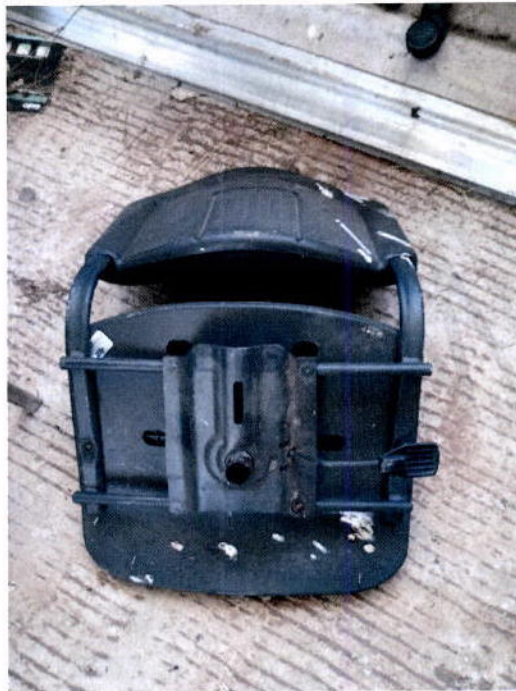
6. Silla secretarial ancha