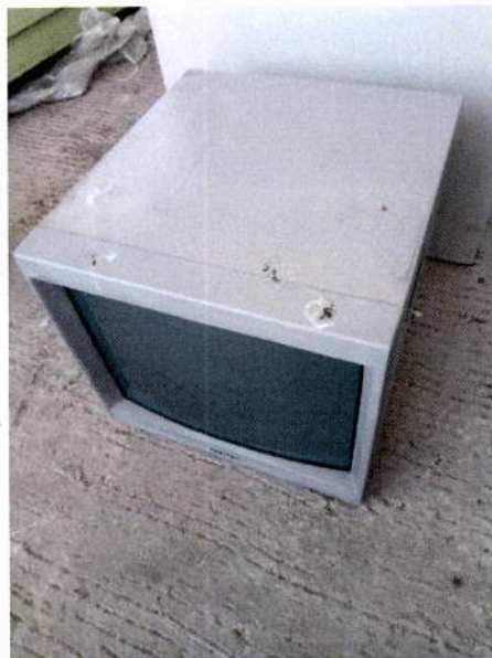
14. Monitor Sony