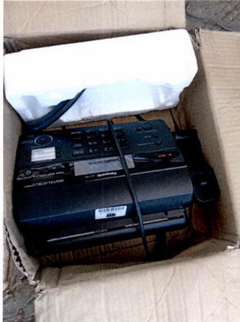
2. Fax Panasonic color negro