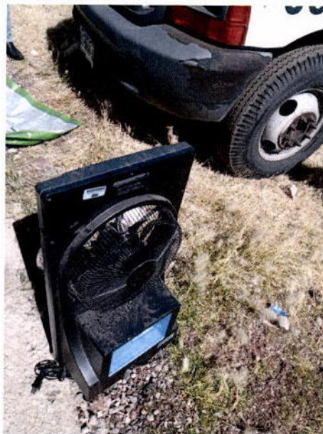
13. Ventilador de piso Armur