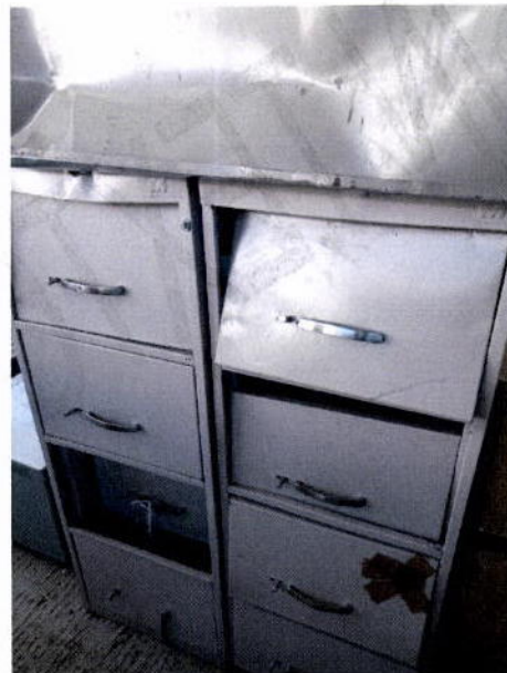
9. Archivero metálico

Handwritten signature in blue ink, possibly reading 'Daw'.