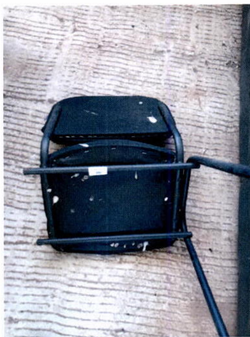
7. Silla apilable

[Handwritten signature] [Handwritten signature]