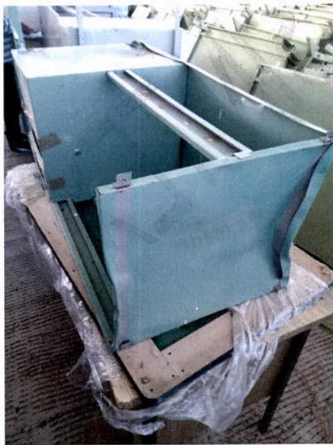
5. Escritorio secretarial