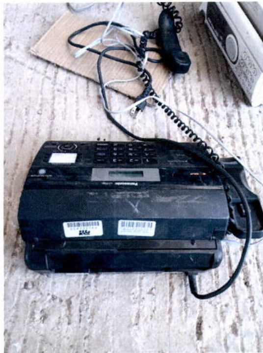
1. Fax Panasonic color negro

Imágenes relacionadas con el Punto TERCERO de la presente Acta.