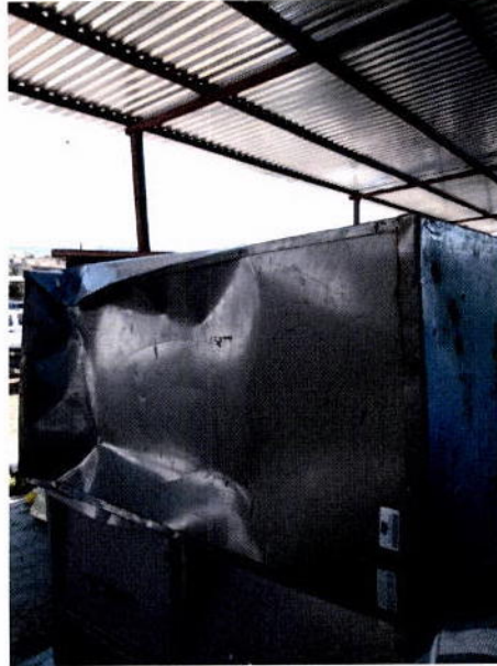
8. Archivero metálico