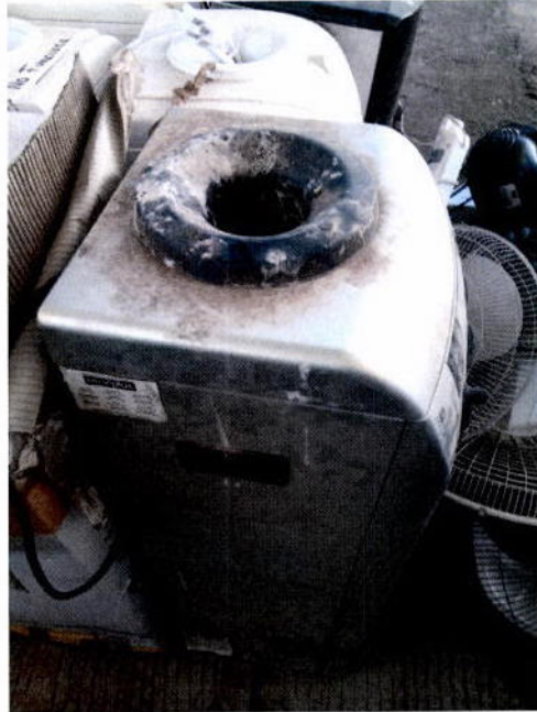
4. Despachador de agua General Electric