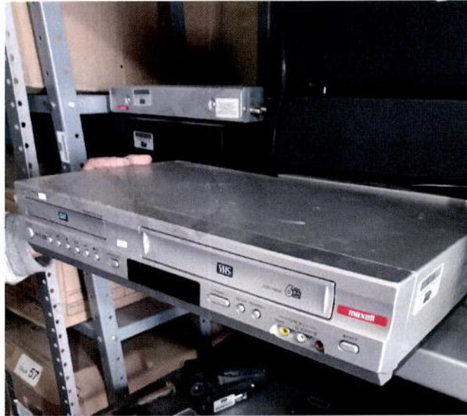
20. DVD Samsung