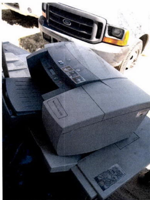
15. Impresora HP