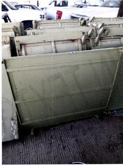
16. Charola góndola para estantería