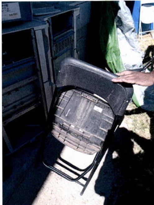
11. Silla plegable