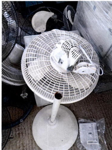
3. Ventilador de pedestal Birtman