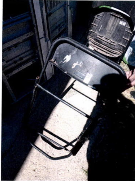
12. Silla plegable Samsonite