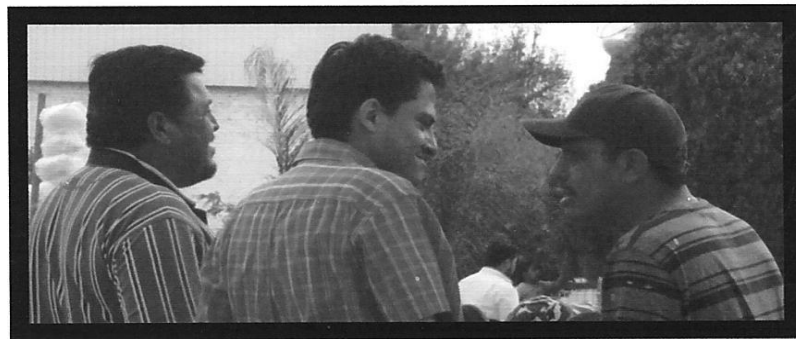
"Imágenes relacionadas con el PUNTO SEGUNDO"