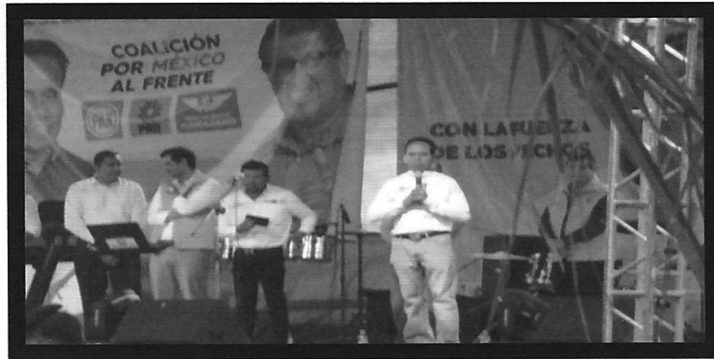
"Imágenes relacionadas con el PUNTO SEGUNDO"