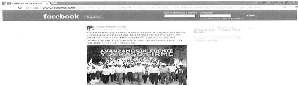
"Imagen relacionada con el punto TERCERO"

Instituto Electoral del Estado de Zacatecas Secretaria Ejecutiva Oficialia Electoral