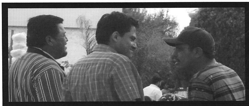
"Imágenes relacionadas con el PUNTO SEGUNDO"

Adicionalmente, el denunciante ofreció como medios de prueba las técnicas consistentes en 11 fotografías relacionadas con las actas de certificación de liga electrónica y de hechos anteriormente descritas, y un disco compacto que