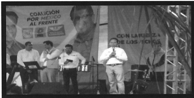
"Imágenes relacionadas con el PUNTO SEGUNDO"