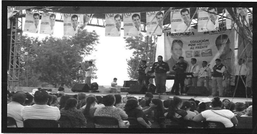
"Imágenes relacionadas con el PUNTO PRIMERO"