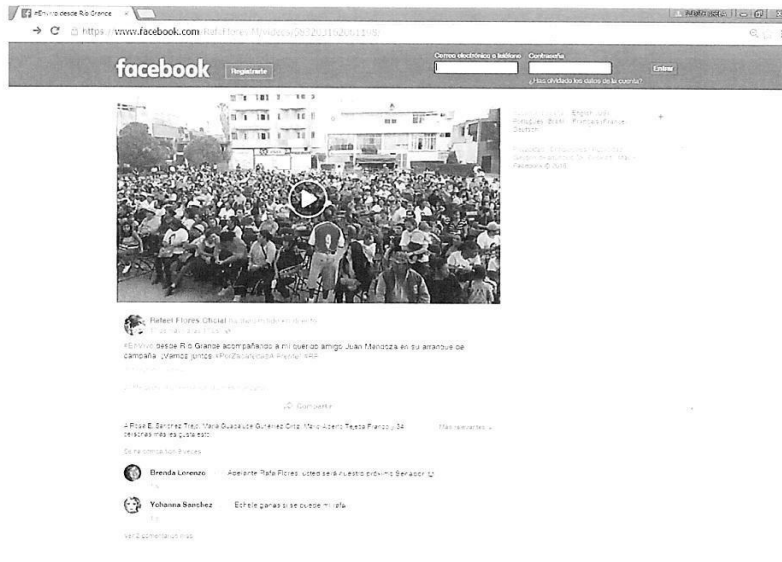
"Imagen relacionada con el punto CUARTO"

Instituto Electoral del Estado de Zacatecas Secretaría Ejecutiva Oficialía Electoral