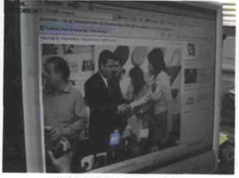
FOTOGRAFIA 2 DOS - El 10 de julio a las 14:03