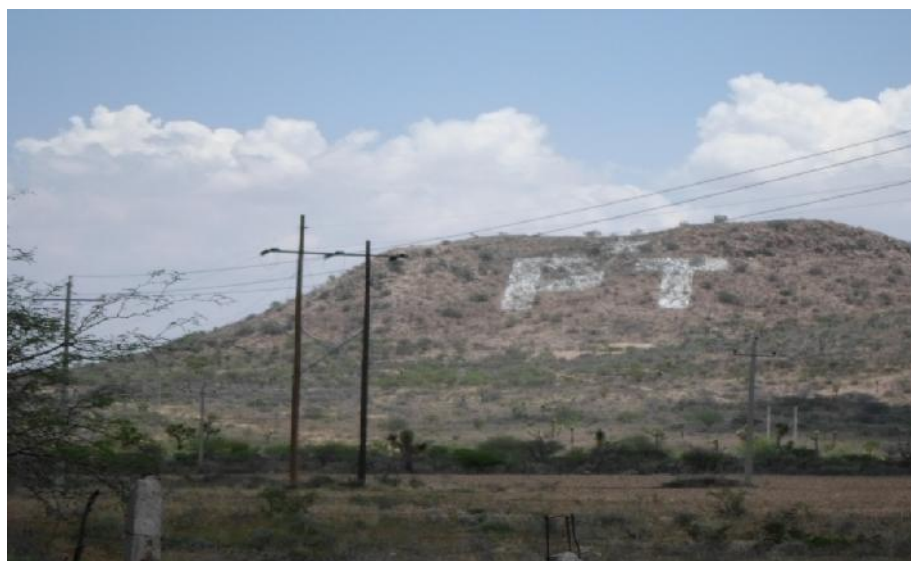
Propaganda electoral ubicada en la carretera Federal 45, en dirección de Fresnillo-Durango, a la altura de la comunidad Ramón López Velarde, Fresnillo, Zacatecas, en el cerro “La Chicharrona”.

6) Documental pública. Consistente en el original del acta circunstanciada levantada a las dieciséis horas con treinta y cinco minutos del nueve de junio de dos mil trece, por personal comisionado de la Dirección Ejecutiva de Asuntos Jurídicos del Instituto Electoral del Estado de Zacatecas. Medio probatorio que