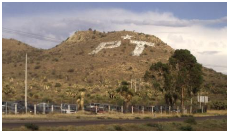
Propaganda electoral ubicada en la carretera Federal 45, en dirección de Durango-Fresnillo, a la altura de la comunidad Ramón López Velarde, Fresnillo, Zacatecas, en el cerro “La Chicharrona”.