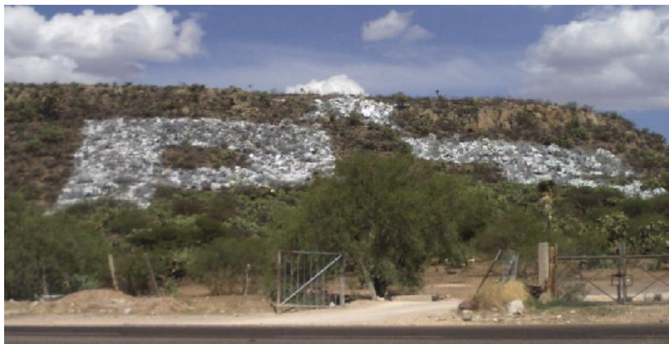
Propaganda electoral ubicada en la carretera Estatal 44, en dirección de Fresnillo-Valparaíso, entre los kilómetros 11 y 12, en el cerro “ Santa Cruz ”, a la altura del entronque a la comunidad El Salto, Fresnillo, Zacatecas.

El referido medio probatorio sirve para acreditar que el personal de la Dirección Ejecutiva de Asuntos Jurídicos del Instituto Electoral, dio fe que en la carretera Estatal 44, en dirección de Fresnillo-Valparaíso, a la altura del entronque a la comunidad El Salto, Fresnillo, Zacatecas, entre los kilómetros 11 y 12, en el —accidente geográfico— cerro “ Santa Cruz ”, existe una pinta de color blanco con medidas aproximadas de 80 x 50 metros, en la que se aprecian las siglas “PT” y entre ellas una estrella; de igual forma, que en la misma carretera en dirección de Valparaíso-Fresnillo, entre los kilómetros 15 y 14 a la altura del entronque a la comunidad El Salto, Fresnillo, Zacatecas, en el cerro “ Santa Cruz ”, existe una pinta de color blanco con medidas aproximadas de 80 x 50 metros, en la que se observan las siglas “PT” y entre ellas una estrella.